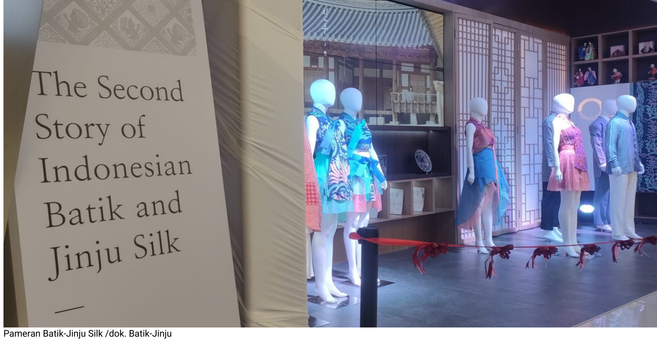
Pameran Batik-Jinju Silk

SELEBRITALK.Pikiran-Rakyat.com - Batik Indonesia telah diakui sebagai warisan budaya tak benda oleh UNESCO. Atas dasar inilah Yayasan Kebudayaan dan Pariwisata Kota Jinju di Korea Selatan tertarik membuat kolaborasi dengan sutera dari Kota Jinju yang juga merupakan warisan budaya leluhur Korea Selatan.