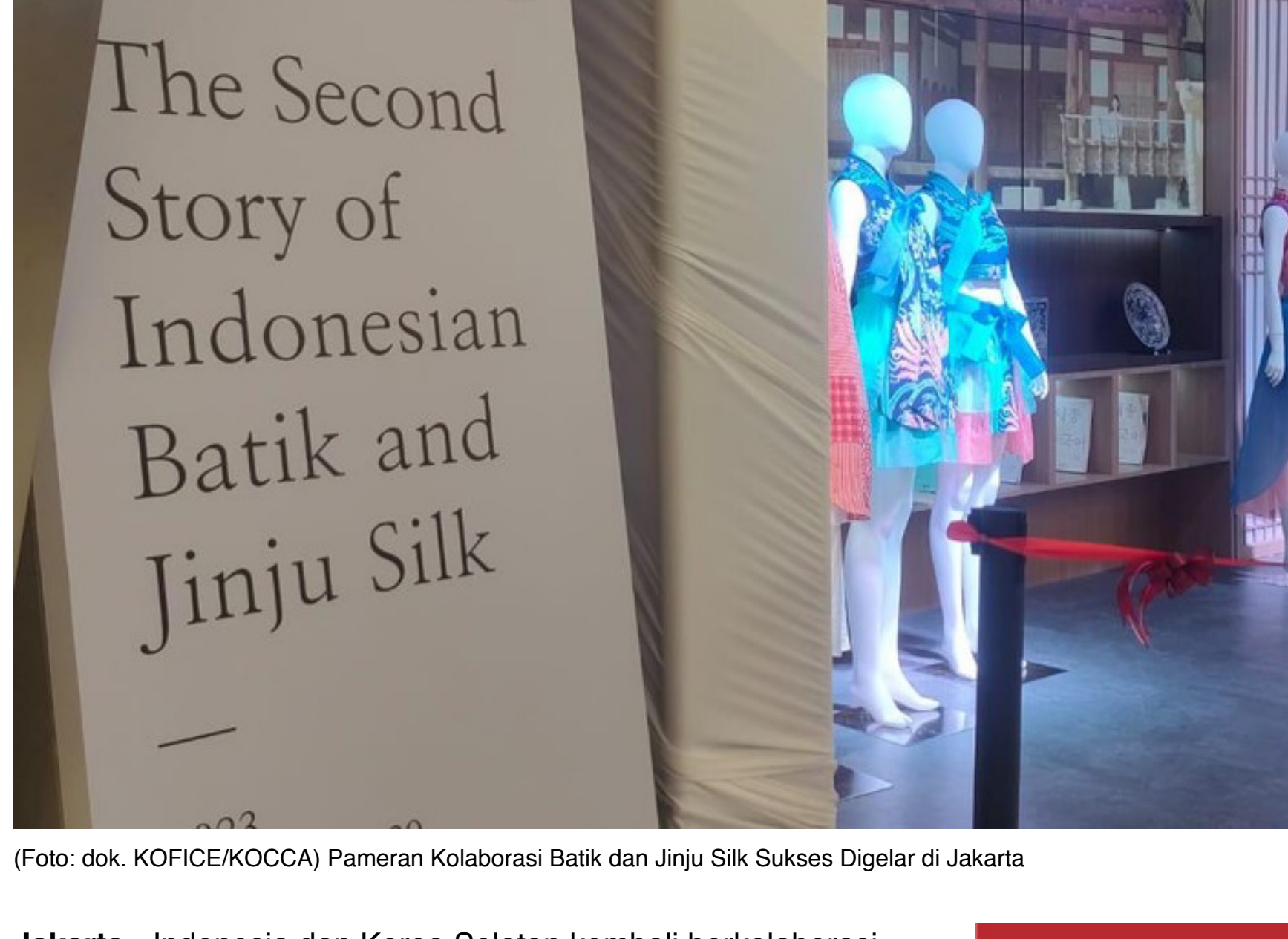
Pameran Kolaborasi Batik dan Jinju Silk Sukses Digelar di Jakarta

Jakarta - Indonesia dan Korea Selatan kembali berkolaborasi dalam hal budaya. Bukan konser K-Pop atau budaya populer lainnya, kolaborasi kali ini terjalin antara kain batik khas Indonesia dengan sutera dari Kota Jinju di Korea Selatan.