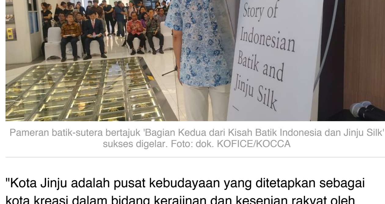
Pameran batik-sutera bertajuk 'Bagian Kedua dari Kisah Batik Indonesia dan Jinju Silk' sukses digelar.

Di sisi lain, Jinju Silk merupakan pusat produsen kain sutera Korea Selatan (80 persen diproduksi di Jinju). Reputasi dan sejarah panjang Kota Jinju dikenal sejak zaman Dinasti Goryeo hingga Dinasti Kekaisaran Korea.