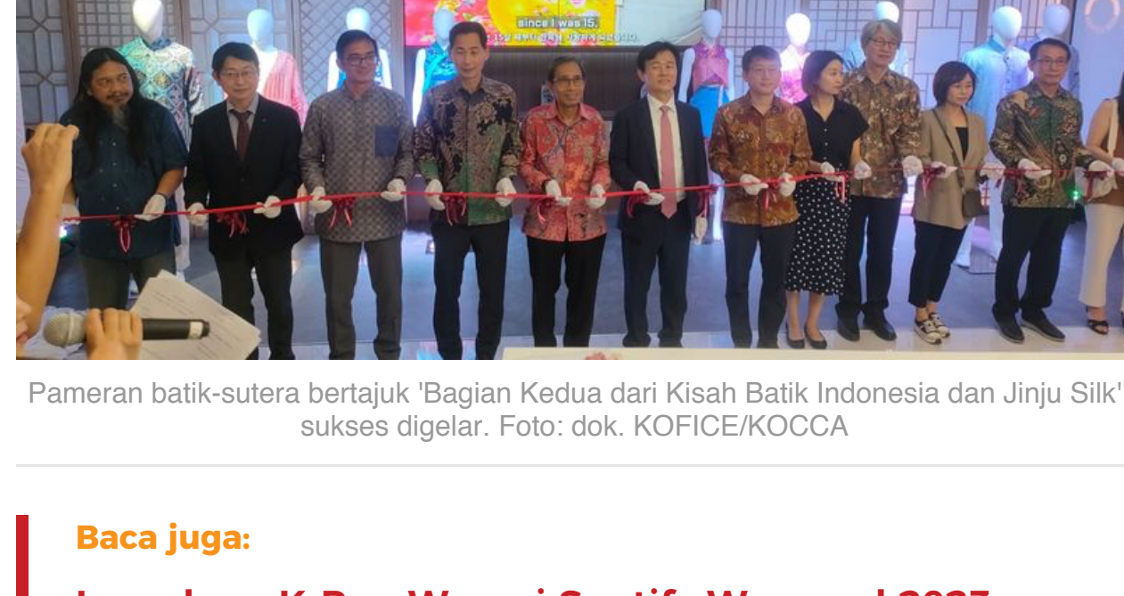
Pameran batik-sutera bertajuk 'Bagian Kedua dari Kisah Batik Indonesia dan Jinju Silk' sukses digelar.